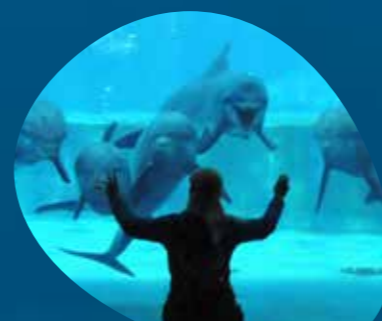
Costa dei delfini PADIGLIONE CETACEI piano inferiore - Main Pool tutti i giorni h. 14:15