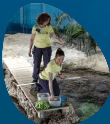
Laguna Tropicale PADIGLIONE BIODIVERSITÀ tutti i giorni h. 10:45

48 incontri settimanali gratuiti con lo staff per scoprire tutti i segreti e le curiosità degli animali. Info e dettagli: www.acquariodigenova.it