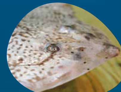
Area Blu Safari PADIGLIONE BIODIVERSITÀ martedì / giovedì / sabato h. 14:45