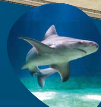
Baia degli squali mercoledì / venerdì / domenica h. 14:45