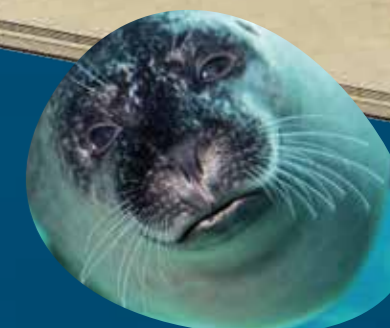
Isola delle foche piano 2 tutti i giorni h. 15:00