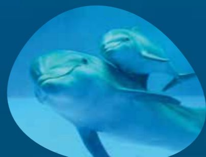
Costa dei delfini PADIGLIONE CETACEI piano inferiore - Nursery tutti i giorni h. 11:30