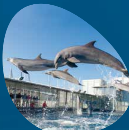
Costa dei delfini PADIGLIONE CETACEI piano superiore tutti i giorni h. 12:00 e 16:15